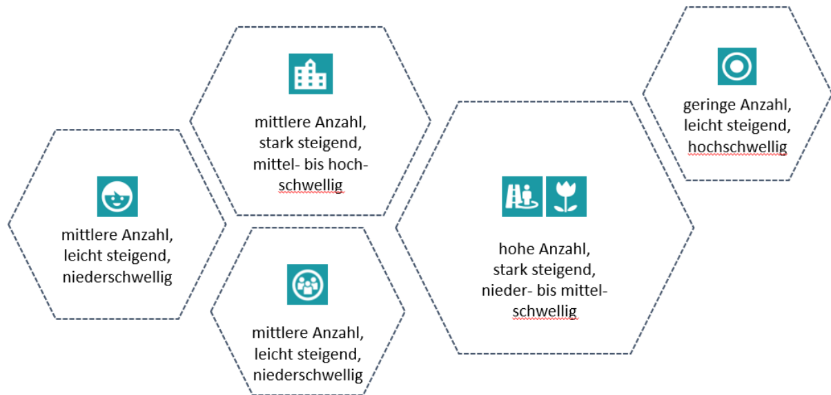
Abbildung 2: Charakteristika verschiedener Partizipationsangebote in Wien